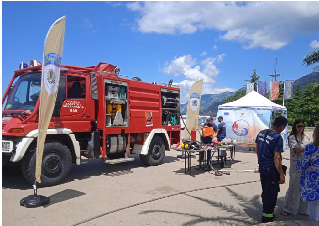
FOTO: PROJEKTI FATKEQËSITË NUK NJOHIN KUFINJ 2 - AKTIVITETE INFORMATIVE