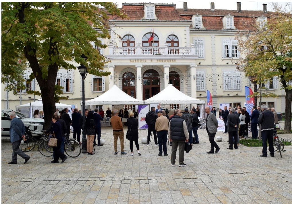
FOTO: PANAIRI I PROJEKTEVE – DITA E BASHKËPUNIMIT EVROPIAN - SHKODER