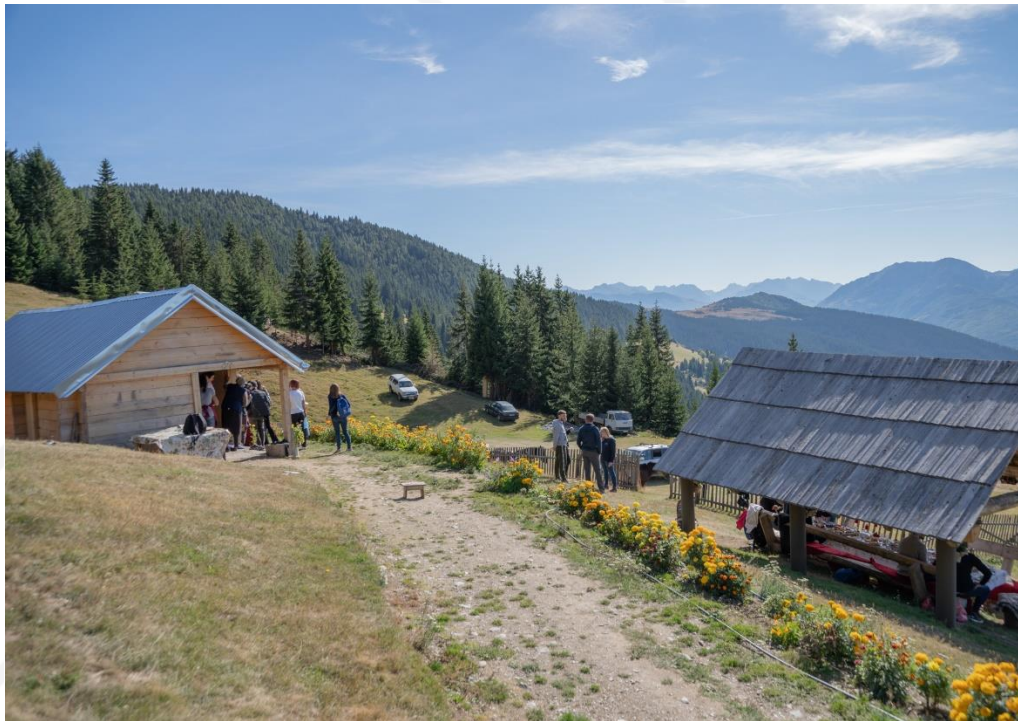
FOTO: ME4EU – STANI I VUJOS - DITA E BASHKËPUNIMIT EVROPIAN - 2021