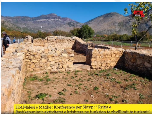
Hot, Malësi e Madhe : Konferencë për Shtyp : " Rritja e Bashkëpunimit-aktivitetet e krishtera në funksion të zhvillimit të turizmit".