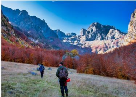
Grebajë valley.

Për më tepër, u krijua gjithashtu një itinerar shtatë-ditor, për të gjithë ata që duan të zbulojnë në një mënyrë unike disa nga sekretet më të ruajtura të zonës ndërkufitare midis Malit të Zi dhe Kosovës. Për më shumë informacion klikoni këtu .