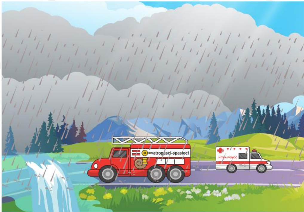
FOTO: FATKEQËSITË NATYRORE NUK NJOHIN KUFINJ