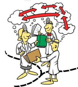
Foto: Bashkëpunimi ndërkufitar evropian për shëndetin: Teoria dhe praktika

Montenegro dhe ECMI Kosovë – (Qendra Evropiane për Çështje të Pakicave) do të zbatojnë projektin që në fokus të aktiviteteve të vet ka shëndetin dhe mirëqënien nëpërmjet përmirësimit të shëndetit riprodhues të grave në zonën e synuar, përmirësimit të cilësisë së shërbimeve shëndetsore, rritjes së vetëdijes për rëndësinë e kontrolleve të rregullta preventive dhe krijimit të shprehisë së parandalimit.